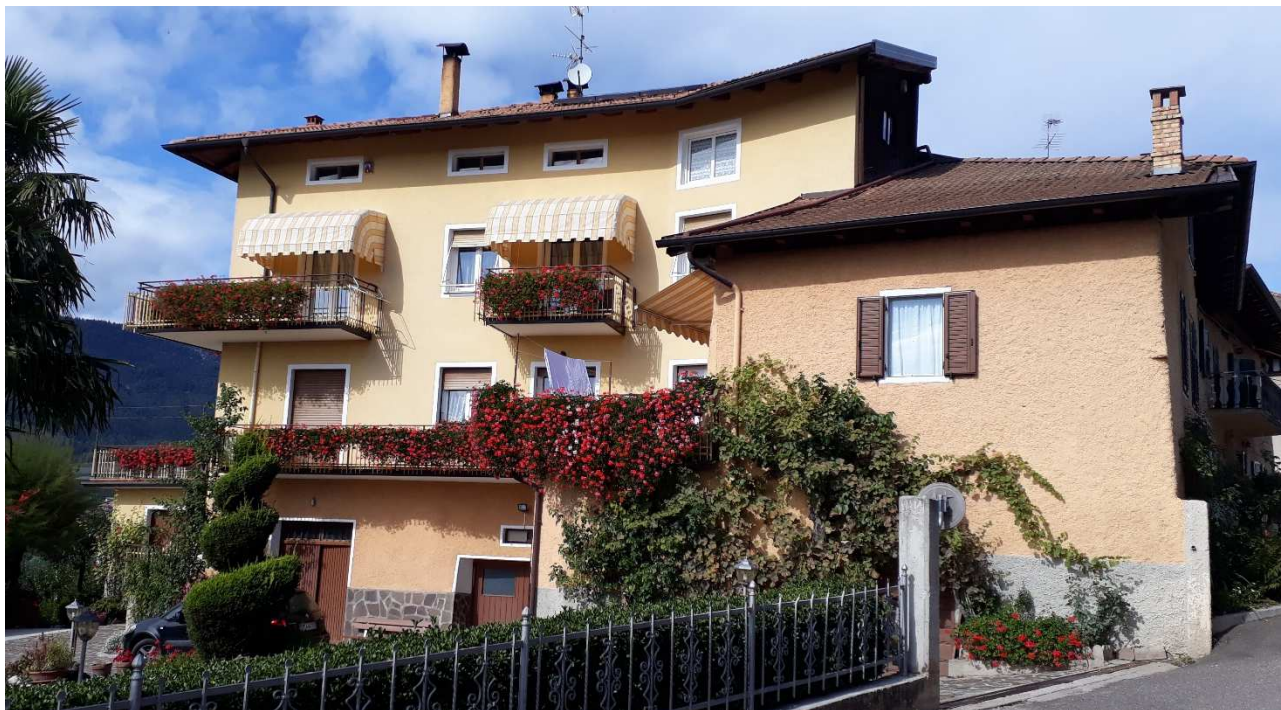
Vista da sud